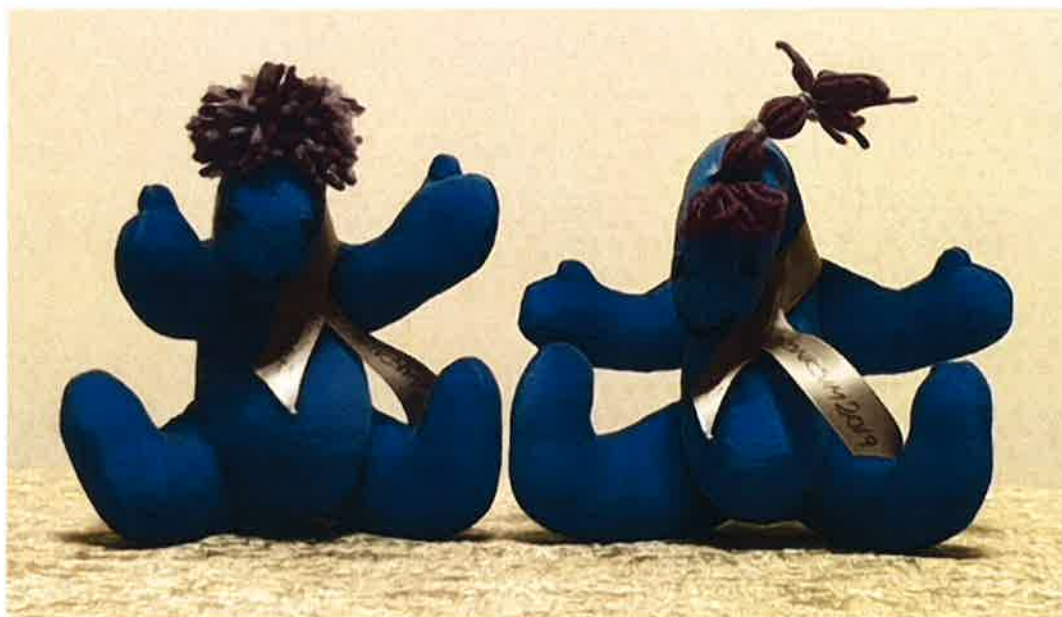
Figur 1. Årets upplaga av de åtråvärda dronkarna.

Dronksimmet i början på februari är en populär tävling bland klubbarna i Skåne. 2019 genomfördes Dronksimmet under två dagar första helgen i februari. Fyra välbesökta tävlingspass genomfördes av vår tävlingsorganisation. Dronksimmet är en av de roligaste tävlingarna att vara med på, både som deltagare och funktionär. Glädjen går inte att ta fel på när årets skörd av dronkar delas ut till våra simmare som är upp till 13 år gamla.